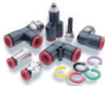
Pneufit C -Plástica -

La línea de conexiones neumáticas Gates está evolucionando constantemente con el fin de rebasar las exigencias del mercado, por ello le ofrece diversos modelos de conexiones para cada una de las aplicaciones de control y movimiento de fluidos, todas ellas disponibles en medidas métricas y estándar.