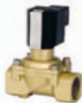
Válvulas de membrana con accionamiento eléctrico